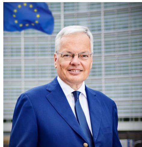
Дидие Рейндерс, комисар по въпросите на правосъдието

“Съдиите, адвокатите, прокурорите — всички, които работят в областта на правосъдието, трябва да бъдат на висотата на предизвикателствата на 21-ви век. Сред тези предизвикателства е изцяло новата област на изкуствения интелект, която трябва да проучим при пълно зачитане на основните права. Текущата криза, свързана с COVID-19, е сериозно напомняне за необходимостта от бърза цифровизация на правосъдието. ”