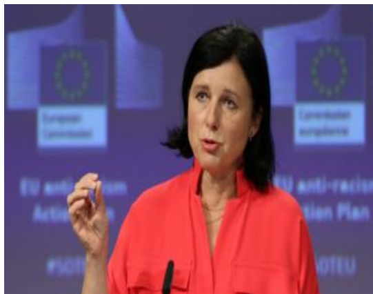
Вера Йоурова, заместник-председател на ЕК с ресор „Ценности и прозрачност“

“Правосъдните системи трябва да бъдат в крак с цифровата трансформация и да отговарят на очакванията на гражданите. Тъй като националните съдилища са и съдилища на ЕС, ние решително подкрепяме този нов подход към цифровизацията на правосъдните системи. ”