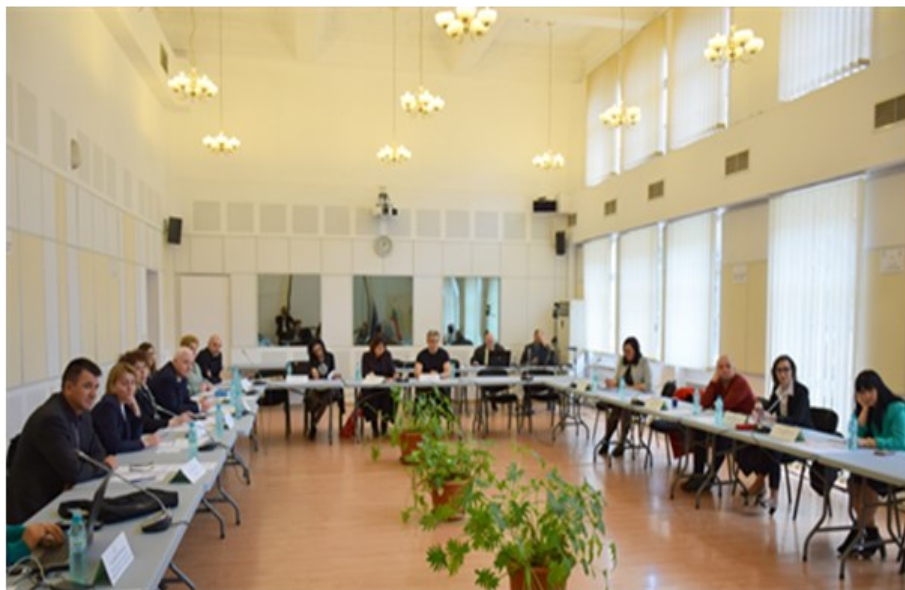
Работна среща на съдиите-наставници, 18.04.2019г., НИП

Иновативният момент при провеждането на срещите беше възможността за включване чрез видеоконферентна връзка от цялата страна.