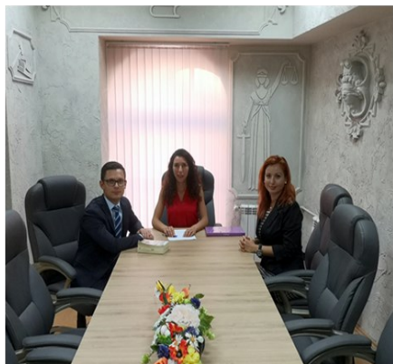
Младите лидери в действие

На 9.11.2018г. за втори път се проведе Ден на самоуправлението в НИП - инициативата се организира в рамките на Дните на отворените врати, които Националният институт на право-