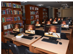
Заповядайте в библиотеката на НИП всеки работен ден от 9.00 до 17.30 ч.

Фондът на библиотеката на НИП наброява над 4000 заглавия, в т. ч. законодателство и съдебна практика в областта на българското, европейското, международното право и правораздаване. Фондът се формира от книги и периодика, закупени със средства от бюджета на Института, както и от дарения на партньорски организации. Според запознати библиотеката на НИП разполага с една от най-богатите колекции със съвременна правна литература. Чудесно улеснение за търсене на информация в библиотечния фонд е електронният библиотечен каталог , достъпен чрез рубриката „Библиотека“, раздел „Електронно обучение и информационни ресурси“ на официалната интернет страница на НИП.