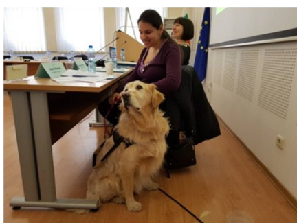
Специален гост на първото обучение за работа с хора със специфични потребности бе и кучето водач Лъки

2018 г. започна интензивно и за дирекцията „Обучение на съдебната администрация“, която отговаря за провеждането на обученията за тази целева група. Освен с теми като „Защита на класифицираната информация в съдебната система“ и „Гражданско деловедство“, превърнали се в неизменна част от програмата на Института, беше подготвен и пореден цикъл на актуализираните теми „Управление на човешките ресурси. Организационни аспекти на съдебната администрация. Статут на съдебните служители“, предназначена за служители с ръководни функции от съдилищата и „Работа с текстове съгласно актуалните граматически правила“, предназначена за служители от Прокуратурата на Република България.