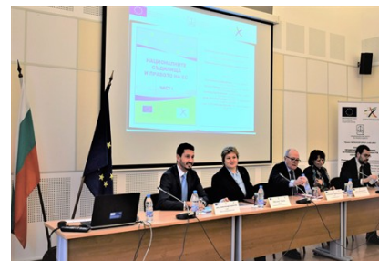
Авторският екип на изданието и директорът на НИП на представянето на книгата