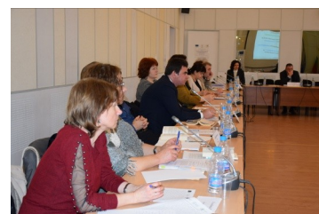
Участниците обогатиха дискусията си с коментари и предложения

На 27.04.2018 г. в НИП предстои провеждането на кръгла маса на тема „ Правни аспекти на устройство на територията “, на която ще бъде представен анализът на втората виртуална общност, посветила усилията си на Закона за устройство на територията.