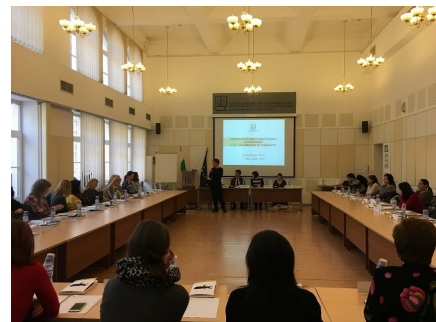
За първи път НИП провежда специализирано обучение за работа с хора със специфични потребности

през м. февруари две обучения за 58 служители от Върховния касационен съд и от Върховния административен съд бе да се изградят и развият умения за обслужване на граждани със зрителни и слухови увреждания. Лектори на обученията бяха експерти от фондация